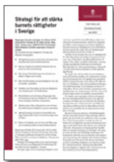
Regeringens direktiv att stärka barnkonventionen