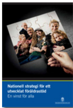
Nationell strategi för att utveckla familjestöd